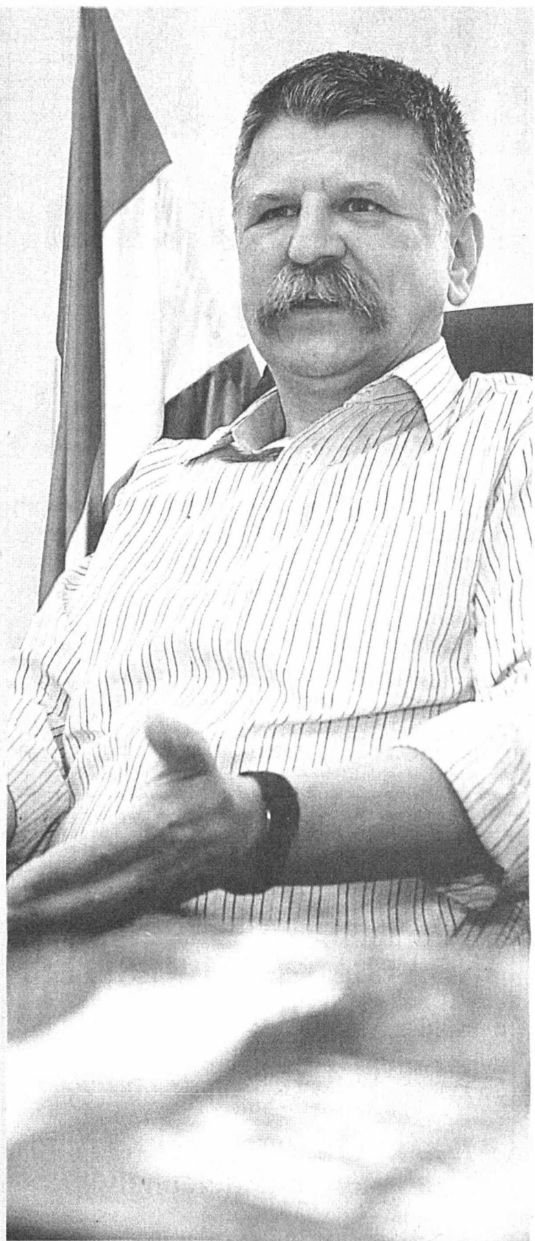
KÖVÉR LÁSZLÓ: Nincs tolerancia a rendszer ellenségeivel szemben

– Ezt másképp látom. Önmagában ezzel nem lesz nagy hatalom a belügyminiszter kezében, viszont annál nagyobb felelősség nyomja majd a vállát. A titkosszolgálatokat eddig egy tárca nélküli miniszter, vagy a kancelláriaminiszter államtitkára ellenőrizte. Az elmúlt nyolc évben olyan mértékben züllesztették le, verték szét morális értelemben is